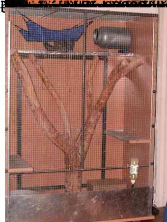
1. A fészekrakó, amely három szintre oszlik, és minden szinten van perches és táplálékadagoló.