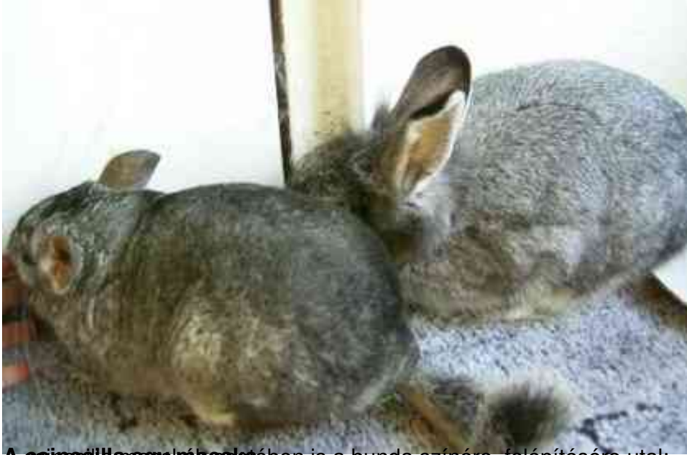
A csimólló egy nácskában is a bunda színére, felépítésére utal: